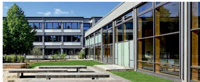
Titelbilder: Loewer + Partner Architekten und Ingenieure, Darmstadt